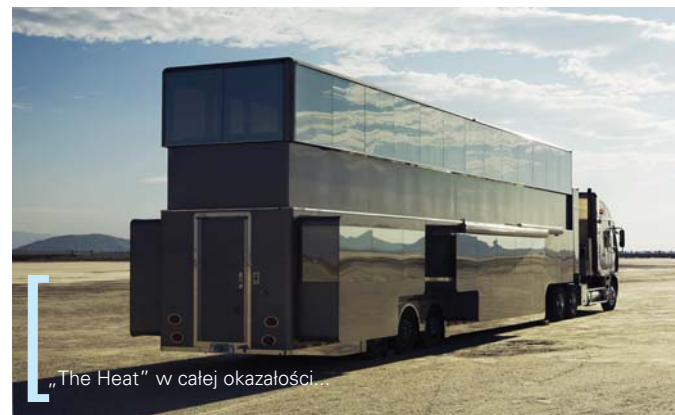
„The Heat” w całej okazałości.

Górny poziom to przestrzeń living room: oczywiście barek, fotele, stoliki i olbrzymia kanapa w kształcie litery „U” na kilkanaście osób! Ciekawostką jest fakt, że „na pięterku” można przy pomocy przycisku sprawić, że przezroczyste szkło zajdzie mgłą... Wystarczy nacisnąć, by już nikt nie widział, co dzieje się wewnątrz. Praktycznie wszystko w środku sterowane jest bezprzewodowo. Przez pilota sterujemy światłem, ogrzewaniem, regulujemy głośność muzyki, włączamy i wyłączamy telewizor. Do uniwersalnego pilota można podłączyć praktycznie każdy system na pokładzie. Łazienki mogą pozazdrościć luksusowe hotele. W jej wnętrzu