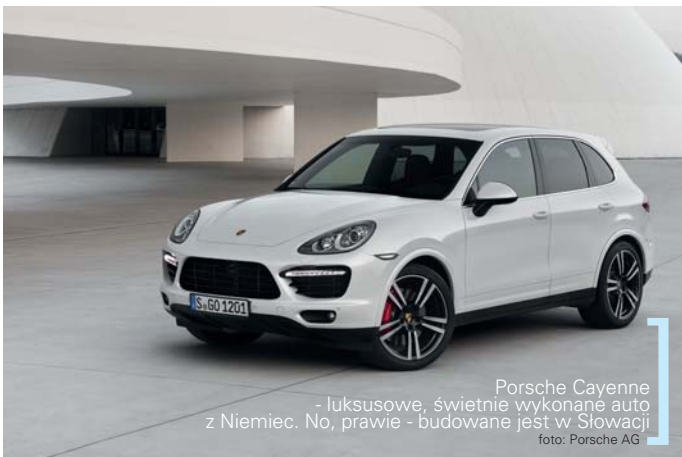
Porsche Cayenne - luksusowe, świetnie wykonane auto z Niemiec. No, prawie - budowane jest w Słowacji

w ten ton, sugerujące, że nie jesteś prawdziwym patriotą, jeśli wspomagasz azjatyckie albo europejskie marki.