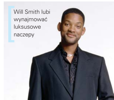
Will Smith lubi wynajmować luksusowe naczepy

Will Smith przyszedł się również na ewentualność, że w tej naczepie oraz w apartamencie... zabraknie mu miejsca. Dlatego wynajął też drugą, jedenastometrową! Media nie podają, czy podczas kręcenia zdjęć choć jeden raz skorzystał z drugiej naczepy. Dodajmy, że obydwie zostały wypożyczone z firmy Anderson Mobile Estates, która wypożycza je także innym gwiazdom Hollywood. ■